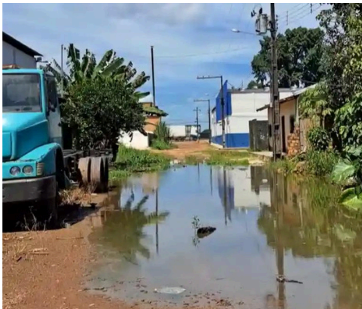
IMAGEM: JORGE OLIVEIRA